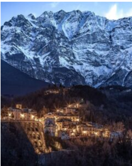
Castelli e la Parete Nord del Monte Camicia

L'Escursionismo educante, visto come strumento partecipativo di una governance integrata. Ci si avvale di questa rivisitata attività in ambiente e si guarda al futuro, a seguito della necessaria conservazione del patrimonio naturale e del patrimonio culturale, della scelta di adeguate politiche e misure per l'adattamento alla crisi climatica e nell'ottica del miglioramento socio-economico e di cittadinanza (ambito attualmente condizionato dall'emergenza sanitaria per Covid 19).