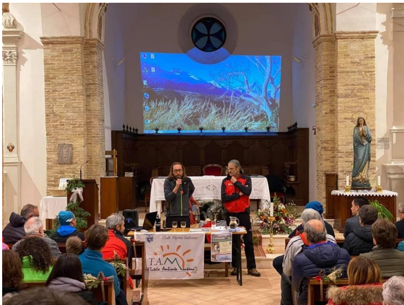
26 dicembre 2019 – Convegno a Castelli “Ricordo e Sicurezza in Montagna”

L'appuntamento annuale diventa occasione di incontro e di riflessione. Tema di questo educante appuntamento insieme al “ricordo” è la “cultura della sicurezza” che nel 2019 (37 a edizione) ha visto svolgere il dedicato Convegno “ricordo e sicurezza in montagna” .