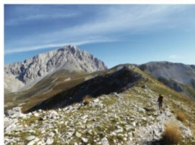
Il Corno Grande del Gran Sasso d'Italia

Il convegno di sabato 26 novembre intende informare e aggiornare cittadini, famiglie e studenti sull'emergenza idrica e climatica, con un approccio interdisciplinare che ne esprima il valore come risorsa. Focus sulle minacce ambientali che interessano l'acquifero del Gran Sasso