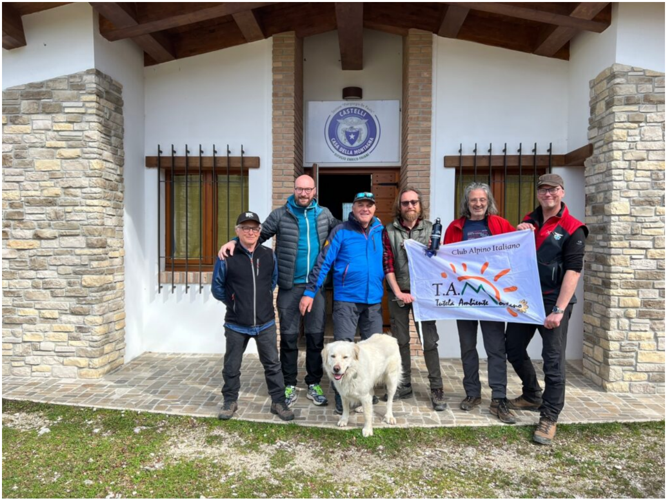
Le Sezioni Cai insieme