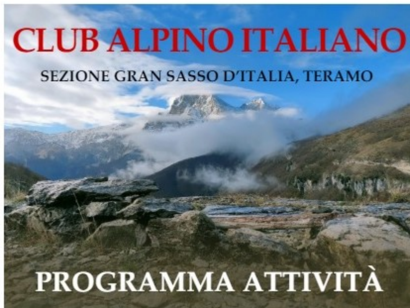
Foto: I due Corni dalla Piansalunga, 4 dicembre 2023