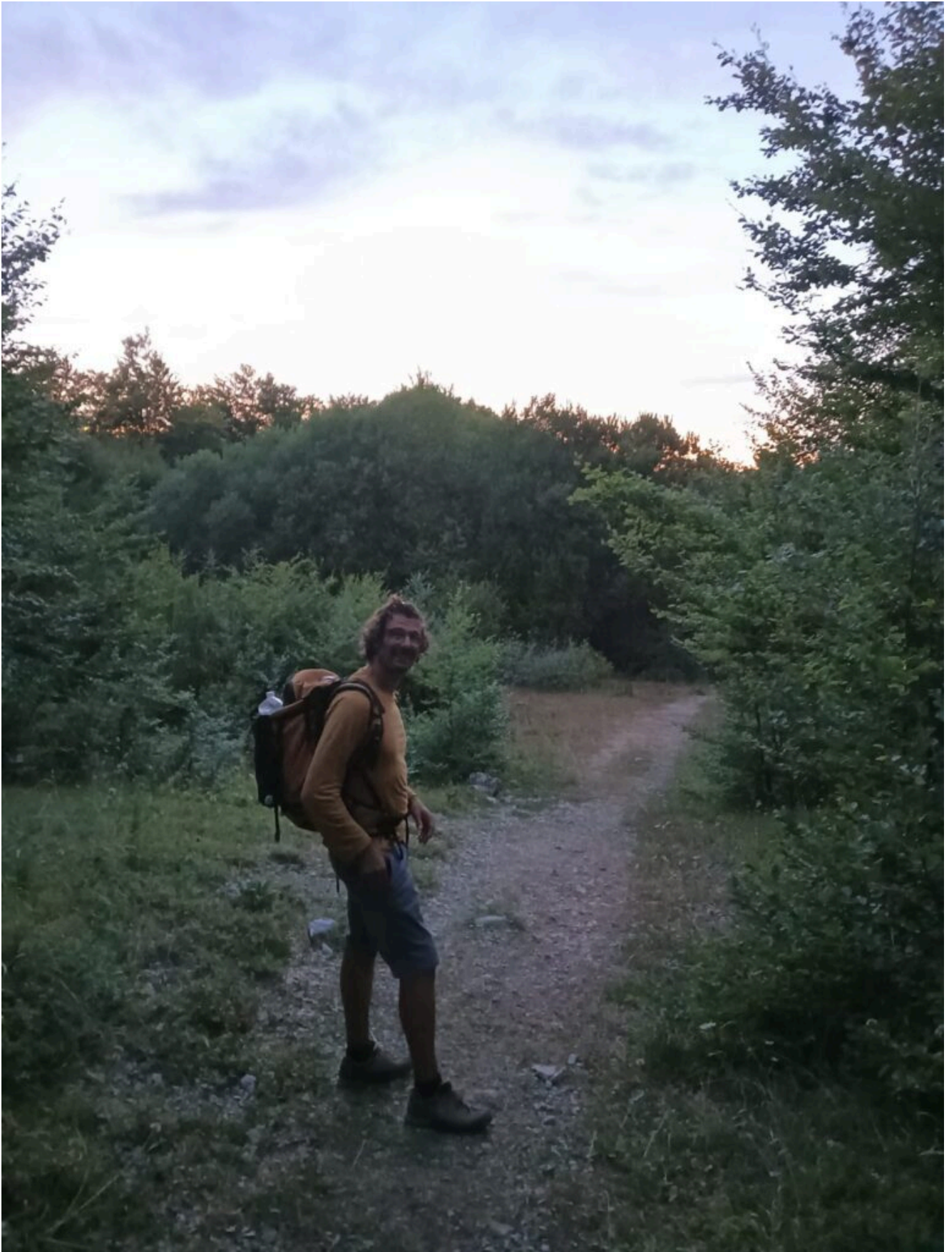
Monte Amaro