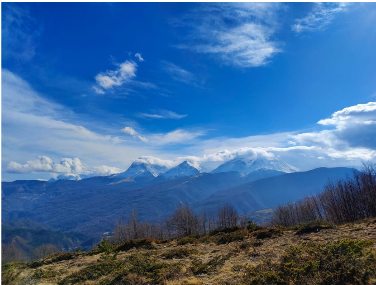
Dai Monti della Laga

Adesso abbiamo il Ministero per gli Affari europei, il Sud, le Politiche di Coesione e il PNRR. Un ventaglio di competenze dal generale al particolare, dall'Europa al Meridione a tutt'Italia e io non mi ci raccapezzo.