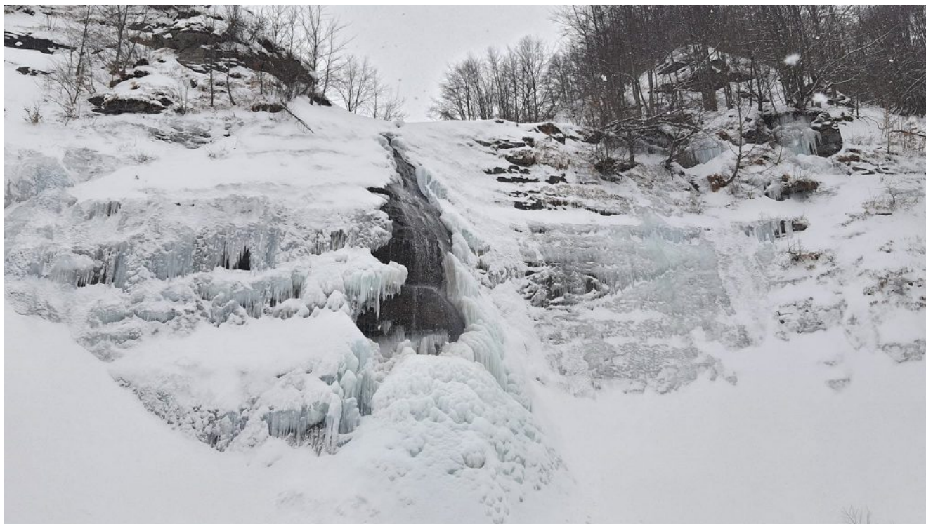
Cascata della Morricana, foto Luigi Pomponi ATTUALIZZIAMO QUANTO FINORA SCRITTO

inondazioni. Ci sarà un depauperamento degli ecosistemi con perdita di biodiversità e produzioni. Le coste saranno minacciate dall'innalzamento del mare. Con la crisi climatica (e si aggiunge una non risolta situazione sanitaria) ne risentirà anche il turismo, volano economico d'Italia. Potrà forse salvarci Agenda 2030?