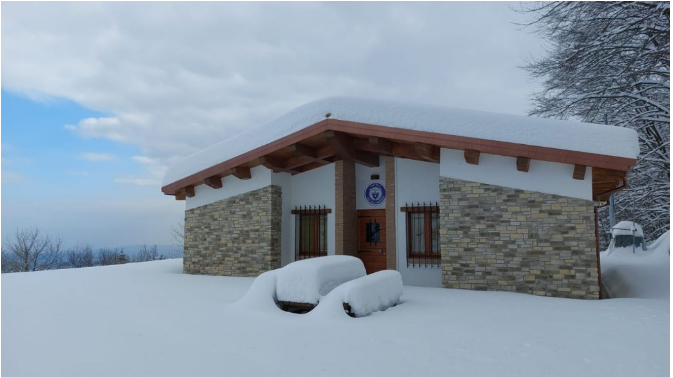
Rifugio Enrico Faiani – Cai Castelli CHE EFFETTI?

Le previsioni indicano che al Nord la siccità rimarrà ( problema grave ). La portata del Po e la risorsa idrica nevosa sulle Alpi occidentali sono ai minimi ( dato Arpa Piemonte ). La ridotta spinta del Po comporta la risalita del cuneo salino ( acqua salata di mare dannosa per le coltivazioni, che si mischia all'acqua dolce fino a 10-15 km dalla costa adriatica ).