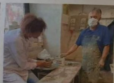
La campionessa con un maestro ceramista