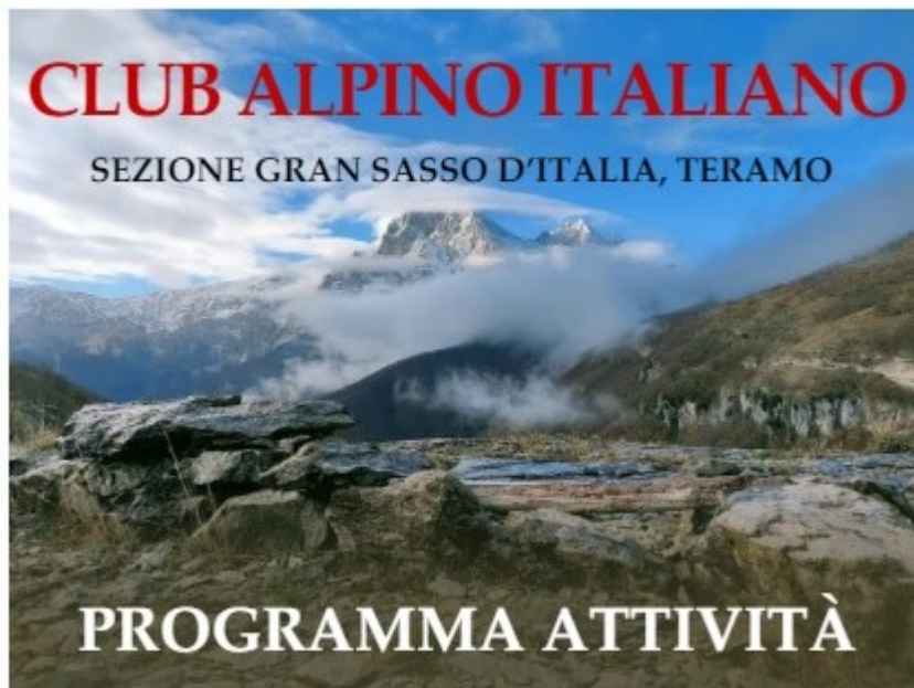
Foto: I due Corni dalla Piansalunga, 4 dicembre 2023