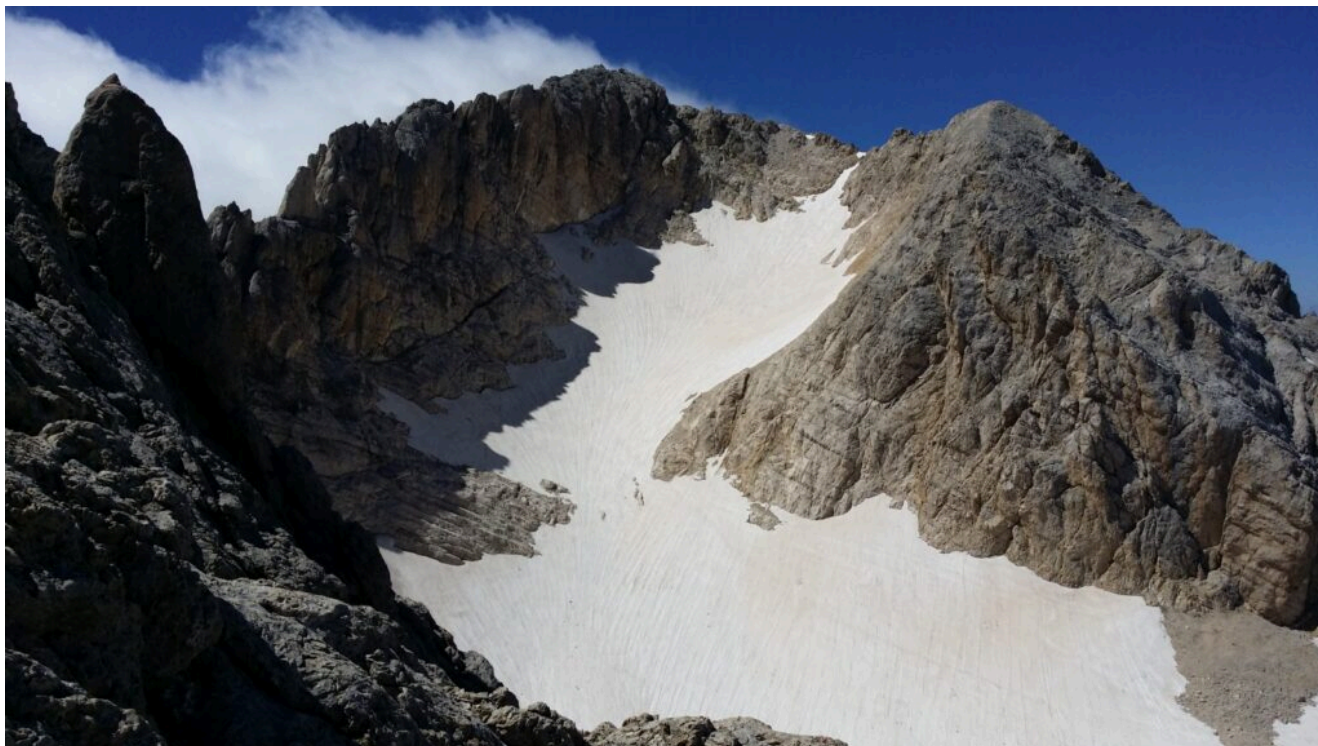
Ghiacciaio del Calderone – foto Luigi Pomponi Rifugio Enrico Faiani

Tornando all'altra montagna il pensiero sorvola il tenace Ghiacciaio del Calderone (link articolo) e quello che ne resta, considerando la sua meridionale posizione, incastonato e protetto tra le tre vette del Corno Grande.