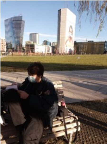
29 gennaio (2) – I CORPI CONTANO Milano, lettere dallo spazio