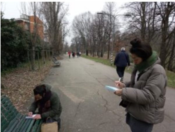
28 gennaio – I CORPI CONTANO Milano, parco lambro Lettere da Tokyo e Milano improvvisamente si è messa a scrivere