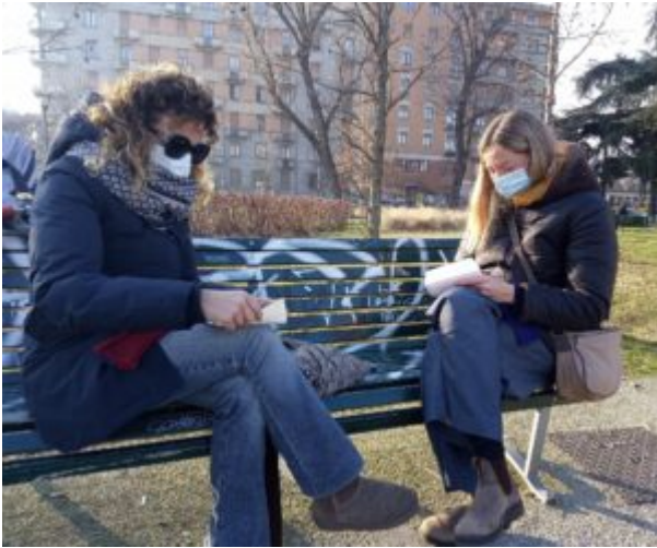
29 gennaio (3) -I CORPI CONTANO Milano, lettere timorose, quasi di nascosto