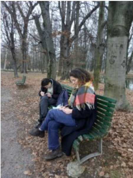
29 gennaio (2) -I CORPI CONTANO Milano, parco lambro Lettere inquinate, ma pur sempre lettere