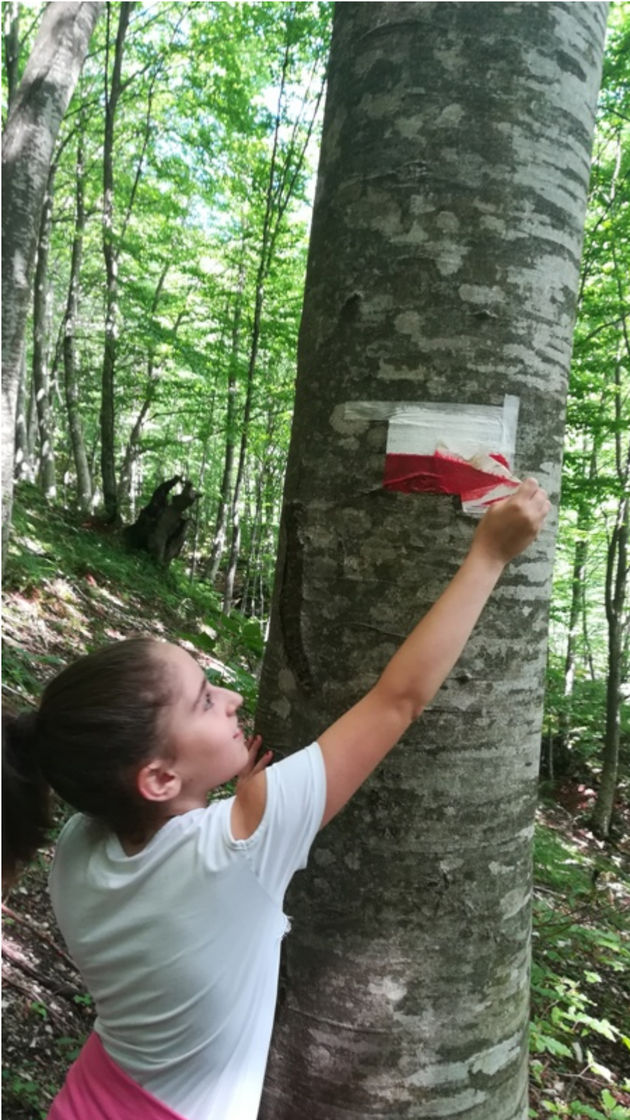
Scuola e Aree Protette

L'Abruzzo è terra di Parchi e di biodiversità. Mondo della Scuola e Sistema delle Aree Protette riescono a stimolare l'attenzione a scelte nella vita quotidiana: alimentazione, letture, mobilità, turismo, uso dell'energia, dell'acqua, del