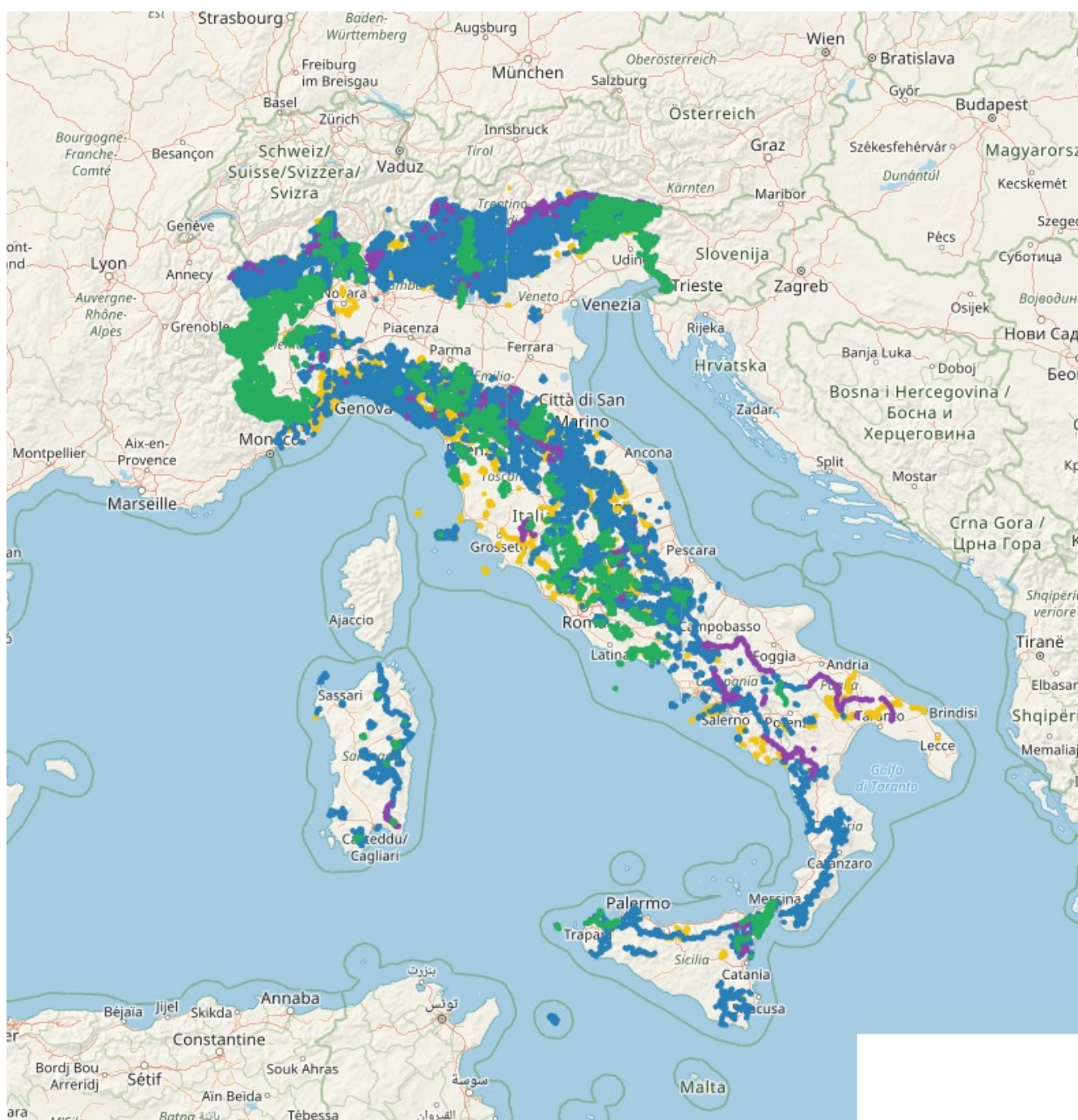
Schermata del Catasto nazionale dei sentieri SENTIERI, RIFUGI e AREE PROTETTE in una montagna viva per

"One health" (una salute unica per esseri umani, mondo animale e mondo vegetale) è un appello vincente. Purtroppo perdita di biodiversità, inquinamento e consumo di suolo influenzano negativamente il nostro "stare bene" .