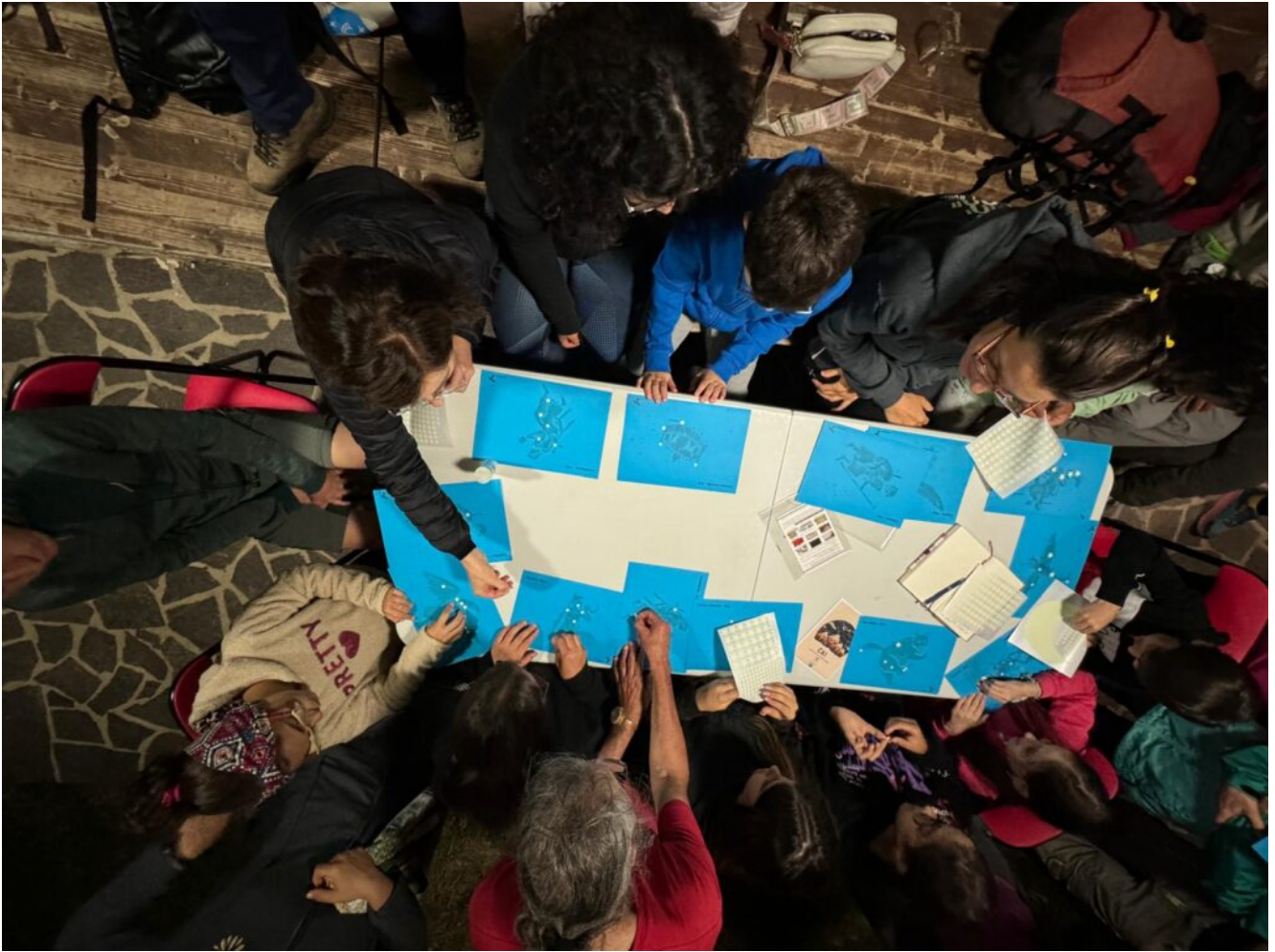
la rappresentazione luminosa delle costellazioni – foto Cai Teramo