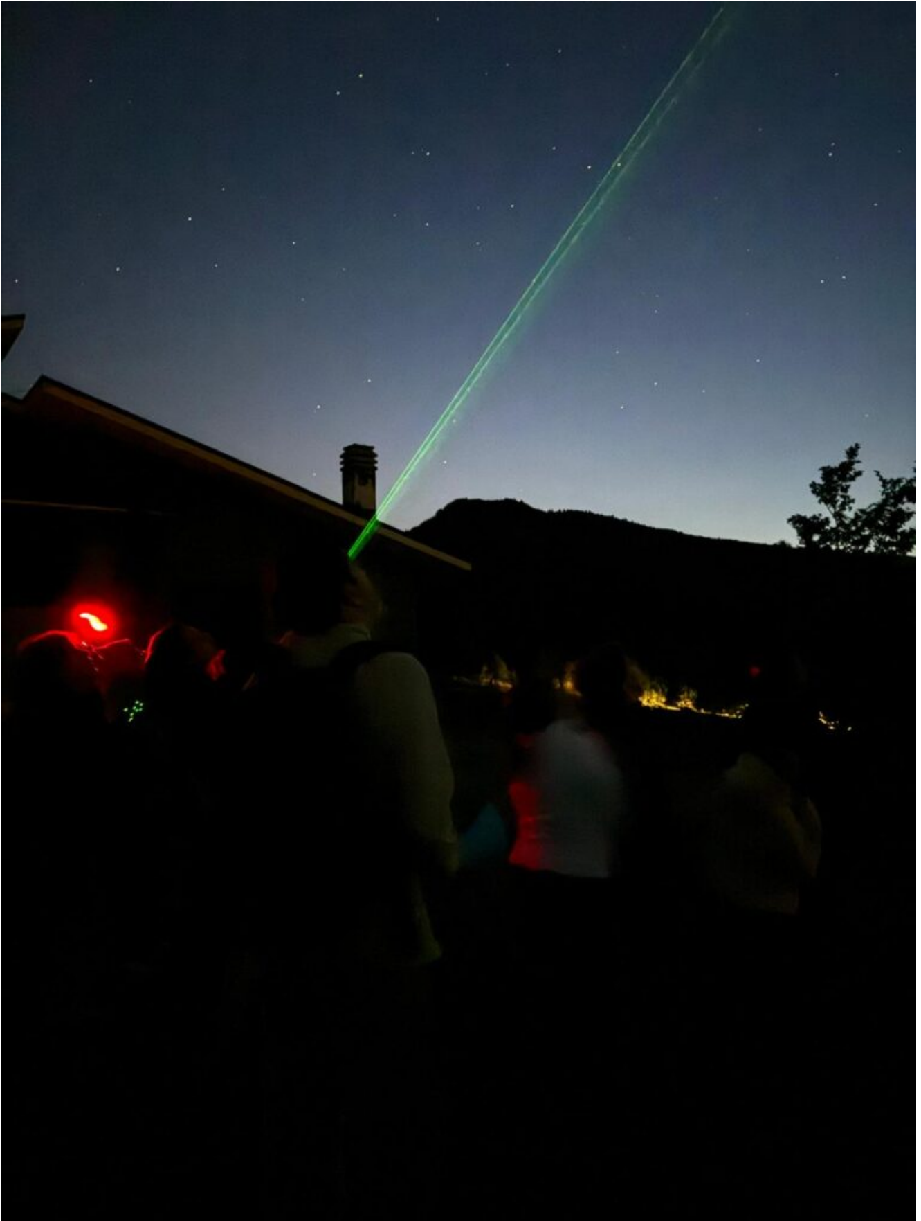
Orientarsi è un gioco