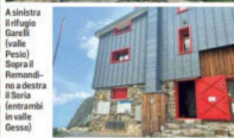
A sinistra il rifugio Garelli (valle Pesio). Sopra il Remondino e a destra il Soria (entrambi in valle Gesso)