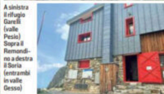
A sinistra il rifugio Garelli (valle Pesio). Sopra il Remondino e a destra il Soria (entrambi in valle Gesso)