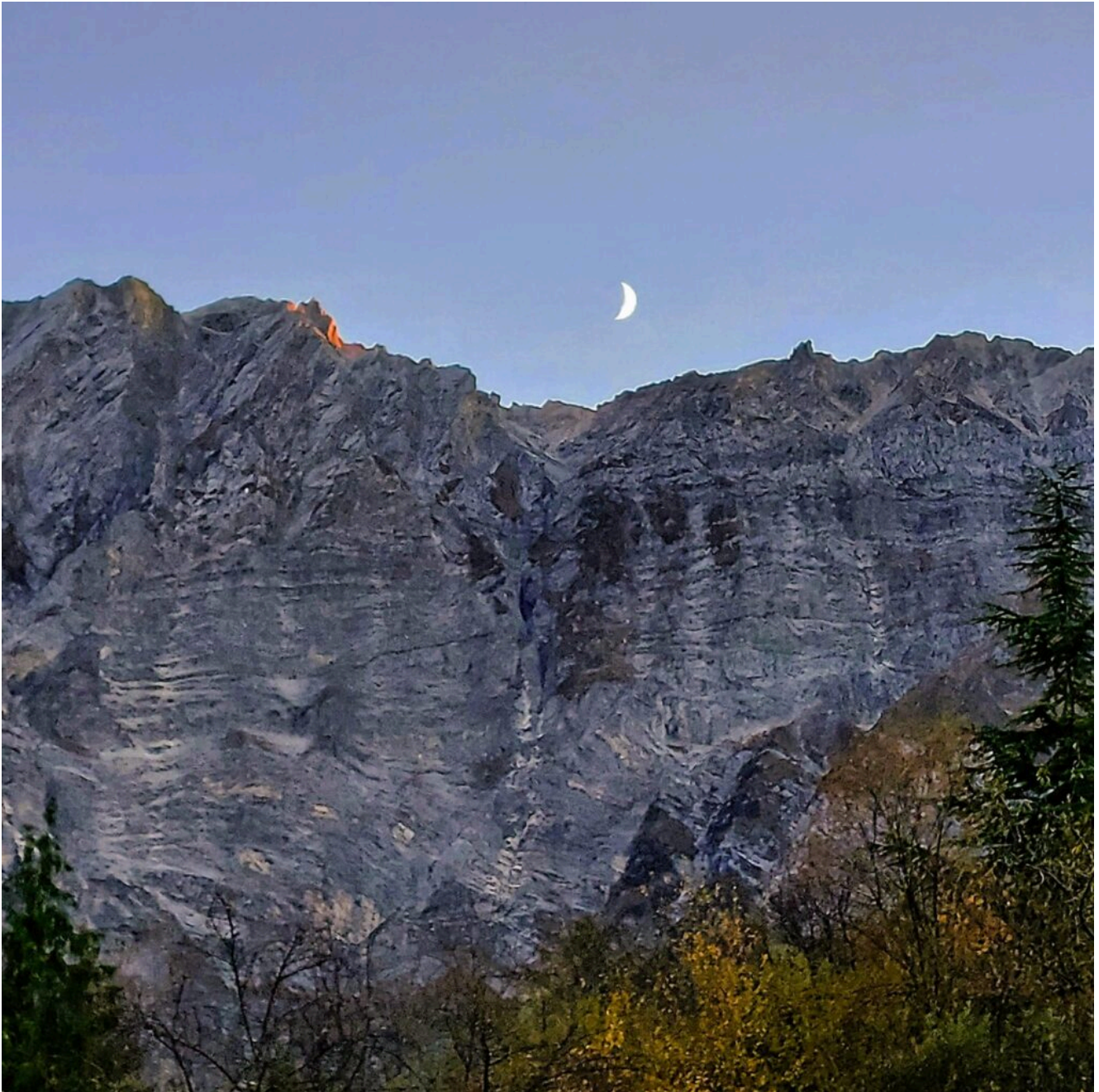
Monte Camicia, foto Francesca Di Gabriele –