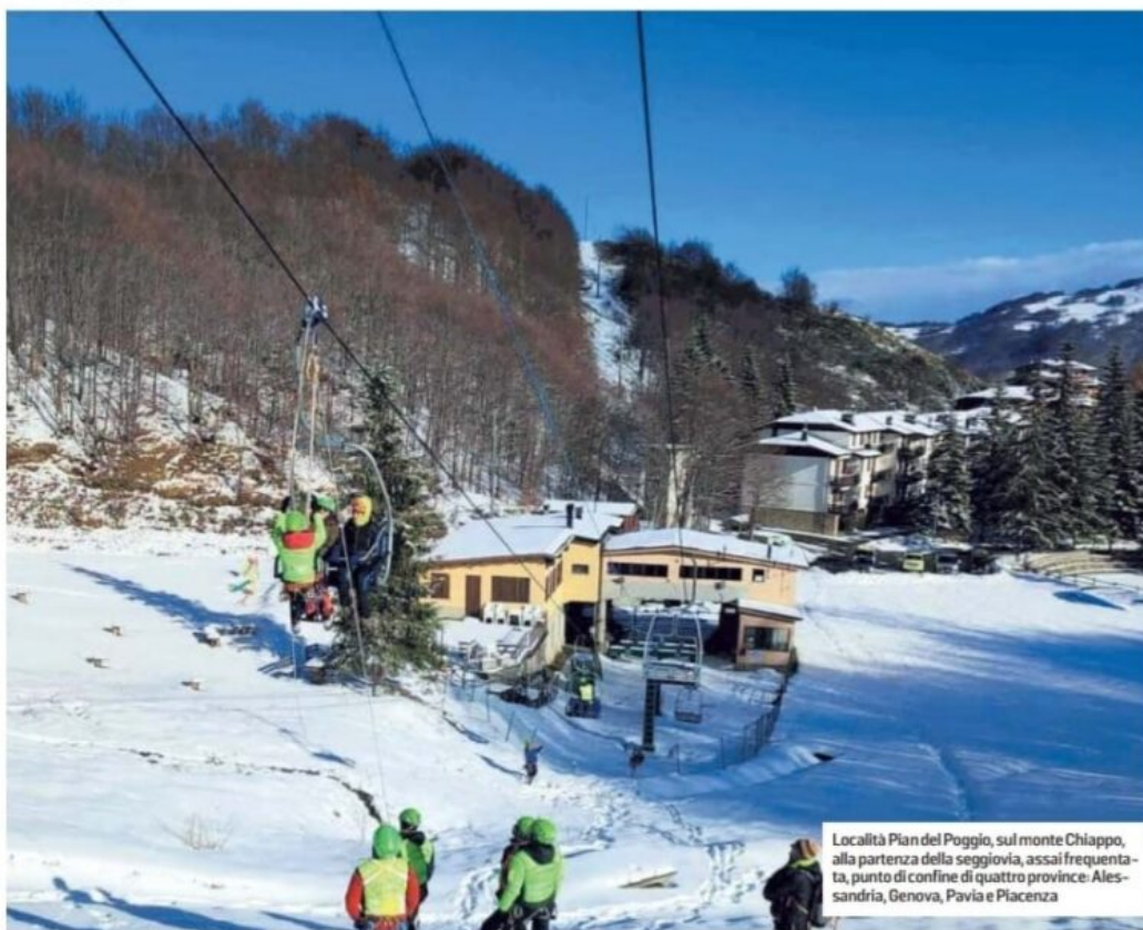
Località Pian del Poggio, sul monte Chiappo, alla partenza della seggiovia, assai frequentata, punto di confine di quattro province: Alessandria, Genova, Pavia e Piacenza

Il Comune di Santa Margherita Staffora, a dicembre, ha approvato un intervento di «parziale innnevamento programmato del comprensorio sciistico di Pian del Poggio», impianto di proprietà comunale. La spesa è di 128 mila euro, quasi interamente finanziata dalla Comunità montana dell'Oltrepò Pavese. Una decisione contestata dal Forum Sentieri Vivi 4P, che raggruppa associazioni a tutela del territorio montano delle 4 Province e che parla di scelta «incomprensibile e paradossale». «Negli ultimi 120 anni - dicono - la temperatura sulle Alpi e sugli Appennini è cresciuta a una media due volte più alta rispetto a quella della pianura, con un aumento di 2 gradi. La situazione appare ancora più compromessa sugli Appennini, in relazione alle altitudini generalmente inferiori, con temperature più alte e minori precipitazioni». «Non è più sostenibile pensare - sostiene il Forum - a un Appennino "artificiale" per prolungare l'agonia del settore dello sci, che non sarà più redditizio, non solo per il clima mutato, ma anche per i costi dell'energia e per la scarsità di acqua. Prima si prende coscienza del problema e più tempo ci sarà per ripensare un diverso modello economico e