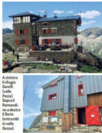
A sinistra il rifugio Garelli (valle Pesio). Sopra il Remondino e a destra il Soria (entrambi in valle Gesso)