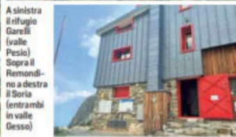
A sinistra il rifugio Garelli (valle Pesio). Sopra il Remondino e a destra il Soria (entrambi in valle Gesso)