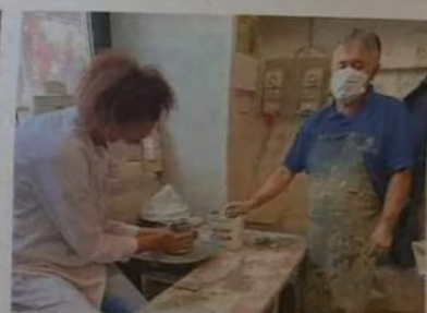
La campionessa con un maestro ceramista

Di Simone ha ammirato il forno a respiro, l'unico rimasto, gli utensili usati in passato e ha ascoltato i racconti. «Lo stupore mi ha accompagnata in ogni momento», ha proseguito, «ho trovato gente accogliente, ho ammirato l'autenticità e la bellezza della secolare arte cera-