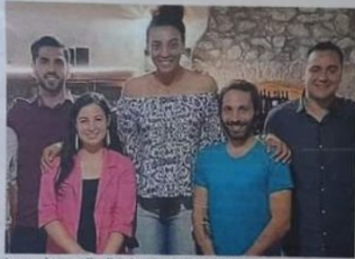
La campionessa di pallavolo Valentina Diouf a Castelli

sportiva. «Con la mia rubrica Vidiviaggi mi piace far conoscere i borghi caratteristici del nostro paese che poi ne costituiscono l'essenza e raccontare tutti i tesori che custodiscono», ha raccontato, «e quando Francesca mi ha parlato di Castelli ho deciso subito di venire a scoprirlo». Valentina ha partecipato alla Notte romantica, l'evento annuale dei Borghi più belli d'Italia e accompagnata dall'amministrazione e dal Cai locale ha fatto un'escursione al Fondo della Salsa sotto al Monte Camicia, ha visitato il museo delle ceramiche, la chiesa di San Donato nota come la "cappella Sistina della maiolica", il Presepe monumentale e