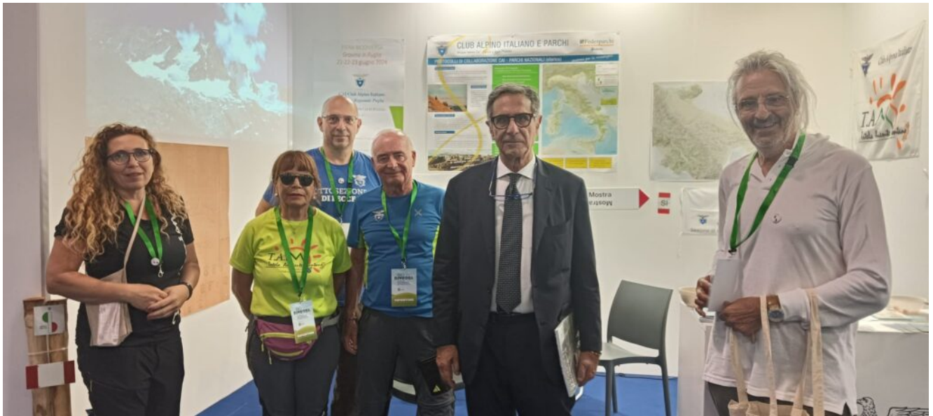
Con il senatore Claudio Barbaro , sottosegretario di Stato al Ministero dell'Ambiente e della Sicurezza Energetica. Il Cai in Puglia