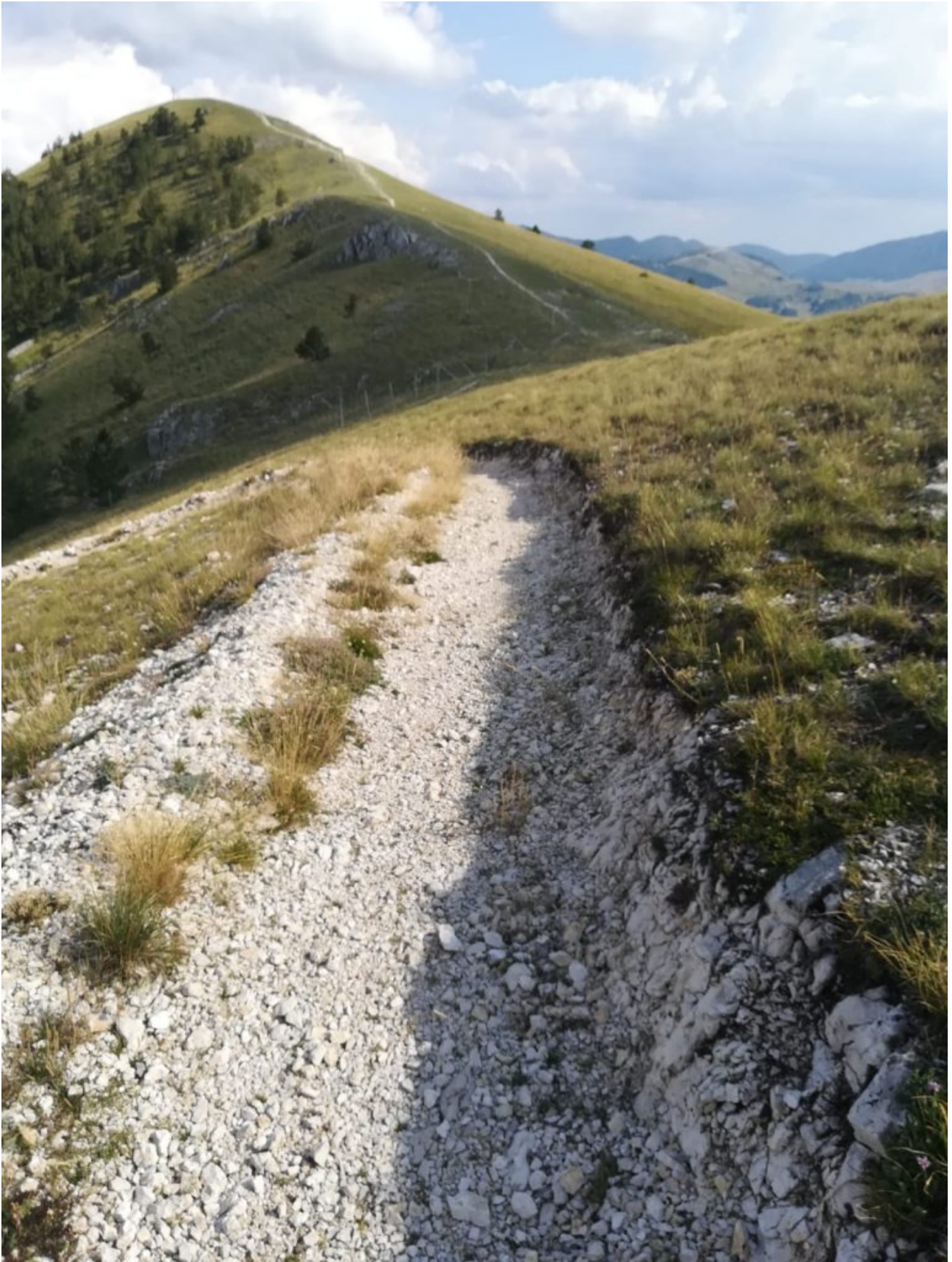
Prima curva in cresta. In fondo il Monte Calvario