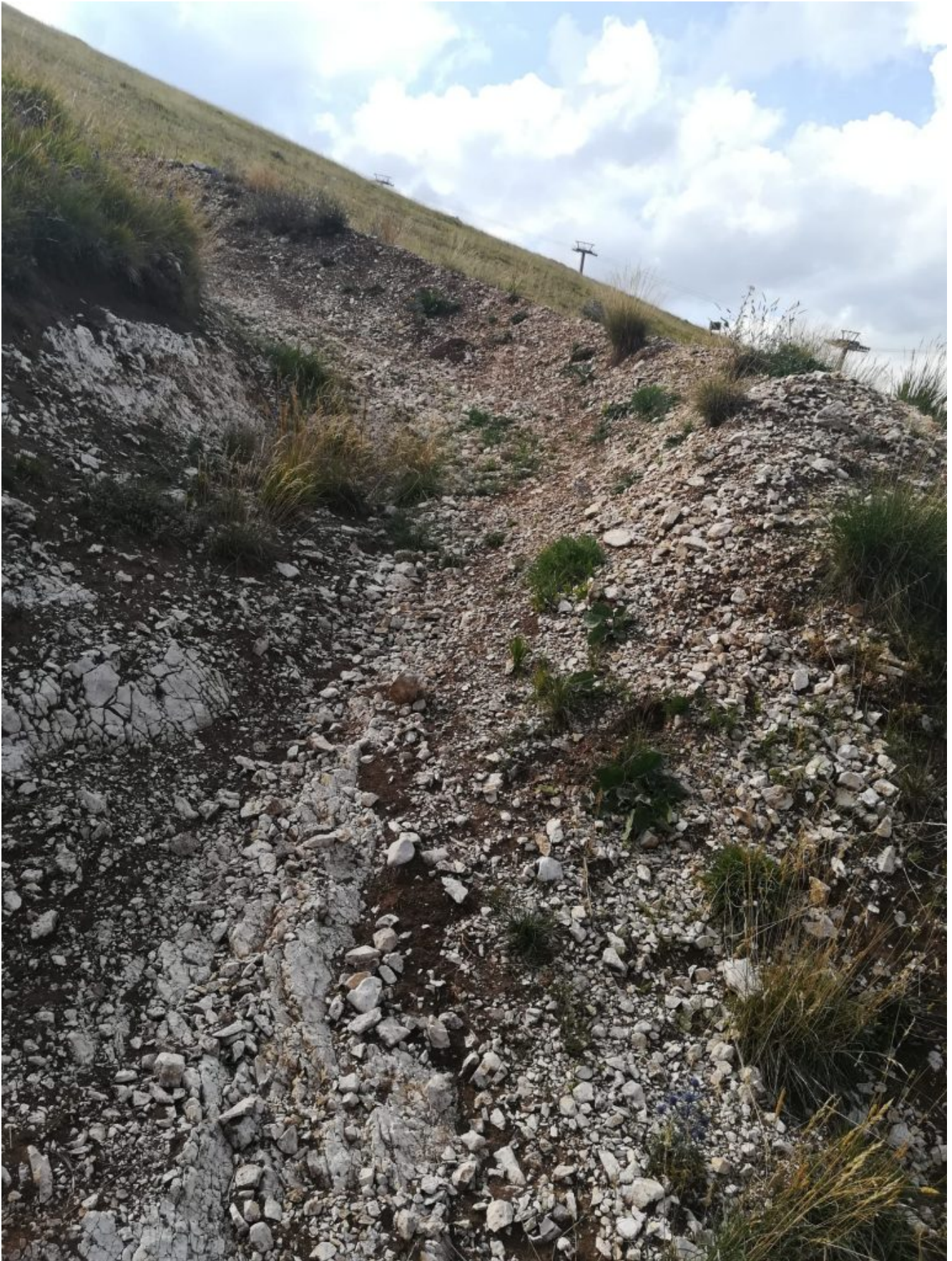
Prima ripida curva in salita Il downhill è uno sport che genera un notevole impatto ambientale ed è una pratica che non corrisponde a una visione sostenibile della frequentazione della montagna.