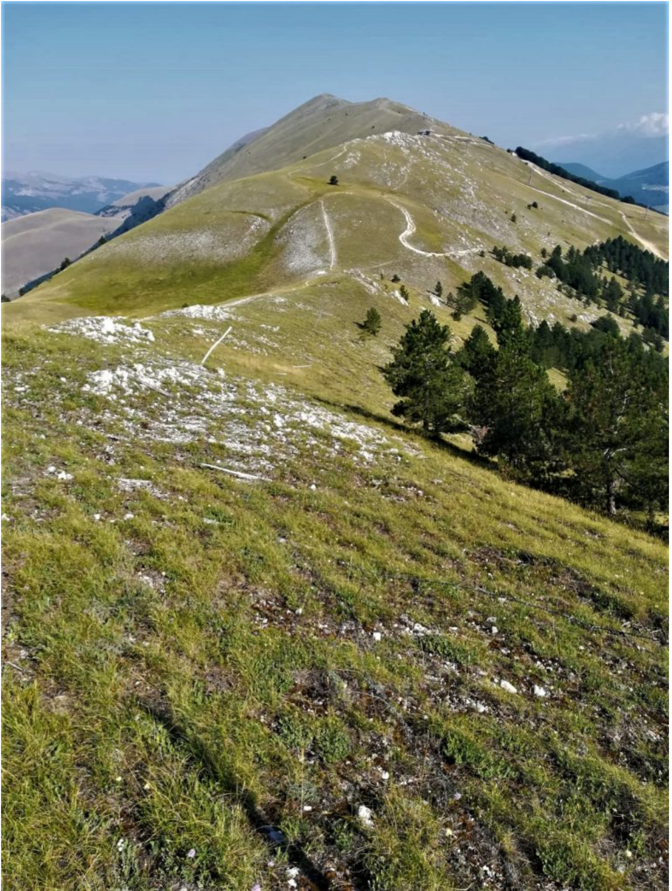
Doppio tracciato in cresta. Sentiero T1 da Rivisondoli al Monte Rotella oltre la vetta in fondo PS 2.