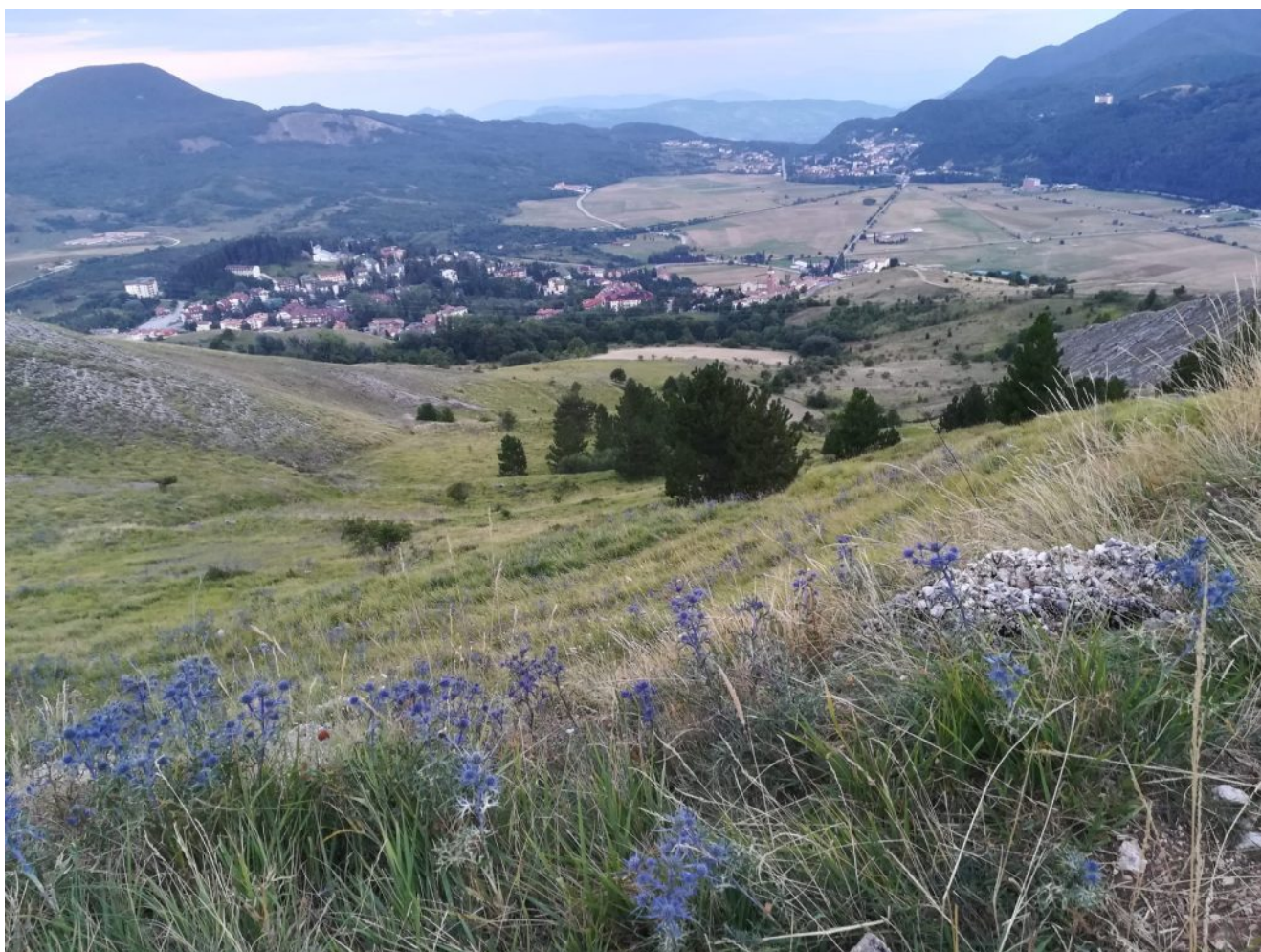
Rivisondoli paese affacciato sull'altopiano 2022 Anno internazionale dello sviluppo sostenibile delle Montagne

Ma per realizzare una pista downhill che autorizzazioni servono? ( l'impatto c'è ed è grande: provare per credere e vi invito a percorrerla a piedi )